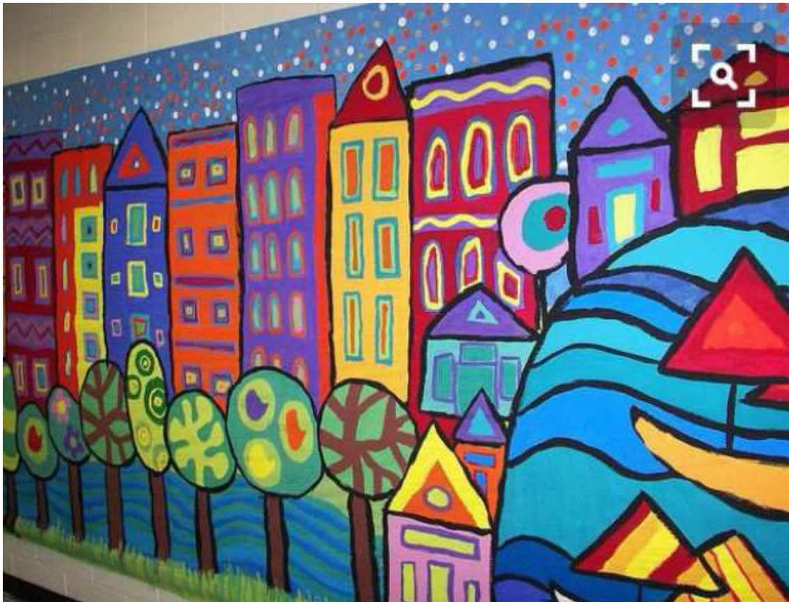
(Opere di Virginia Pacer)